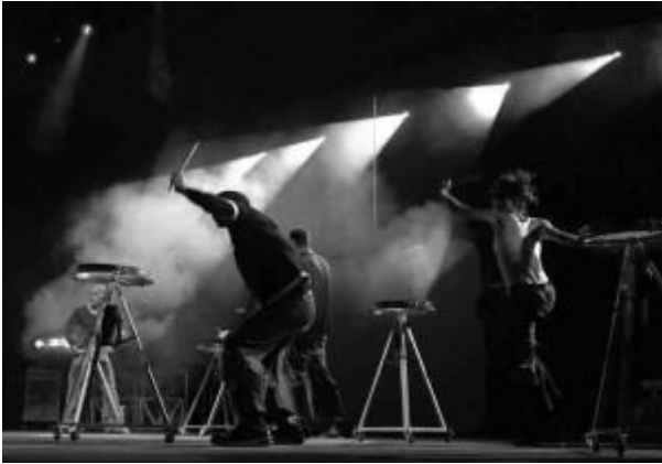
Eventi a Roma

protagonista del primo concerto dell'Orchestra dell'Accademia Nazionale di Santa Cecilia (direttore Kristjan Järvi). Il pianista milanese è impegnato nel "Concerto Campestre" di Francis Poulenc. A completare il programma pagine di Berlioz, Bizet, Boccherini e Ravel. Ingresso da 15 a 40 euro. Viale Pietro De Coubertin 30, informazioni 06/80241281.